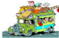
Camps de vacances pour les enfants