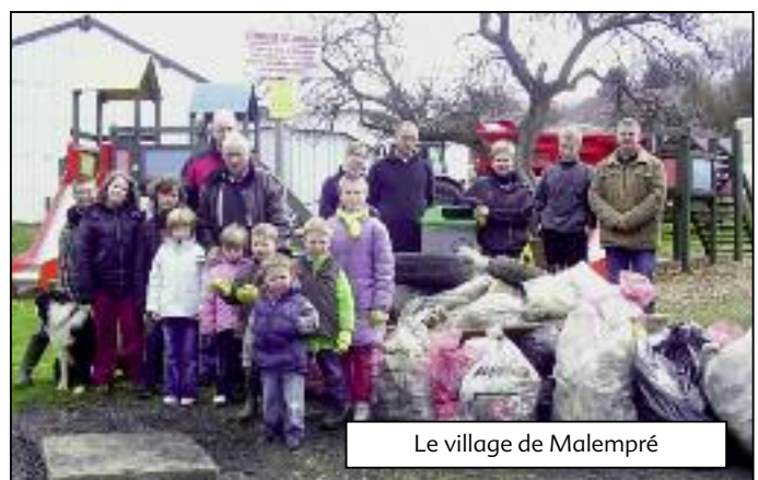
Le village de Malempré