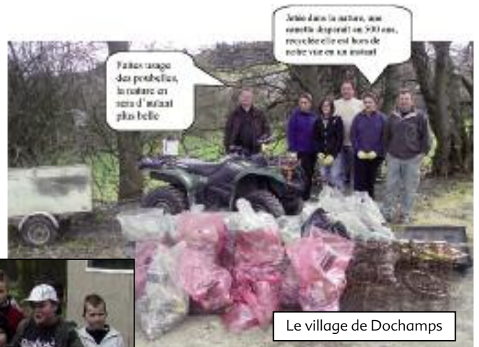
Le village de Dochamps

«Nettoyons la nature, fleurissons notre environnement» : 11.000 plantes vivaces ont été offertes aux bénévoles. Les communes ont également reçu des fleurs pour orner un endroit stratégique et attirer ainsi l'attention des usagers de la route sur le travail accompli. Et chaque enfant s'est vu remettre un certificat de reconnaissance officiel.