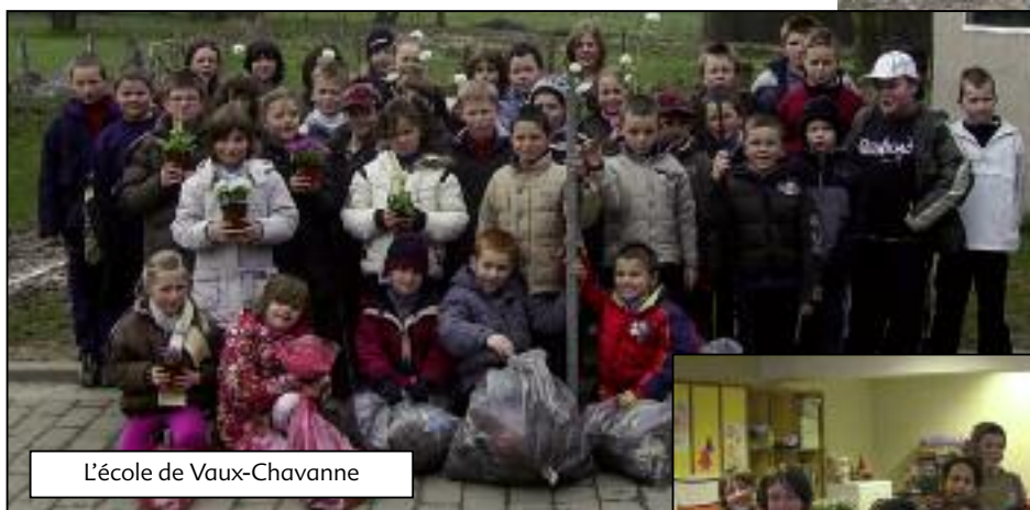
L'école de Vaux-Chavanne