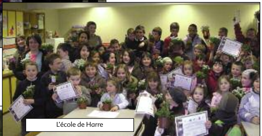
L'école de Harre