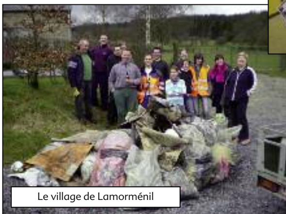
Le village de Lamorménil