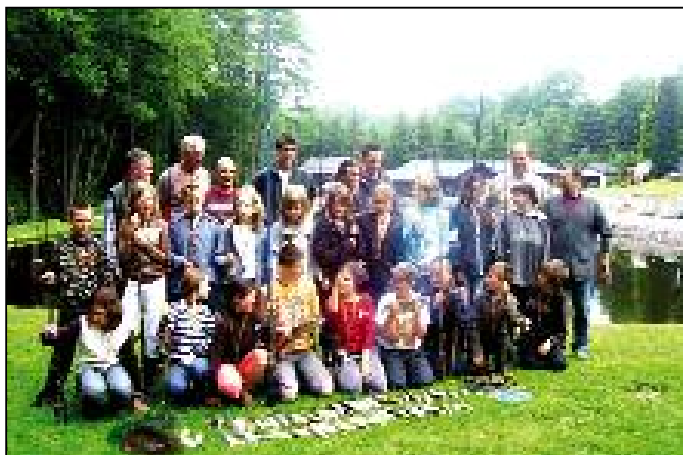
Participants journée du 31 mai 2008