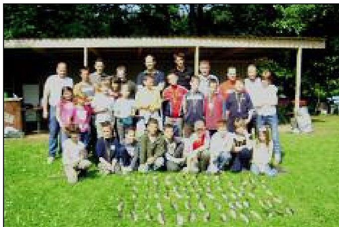
Participants journée du 08 juin 2008