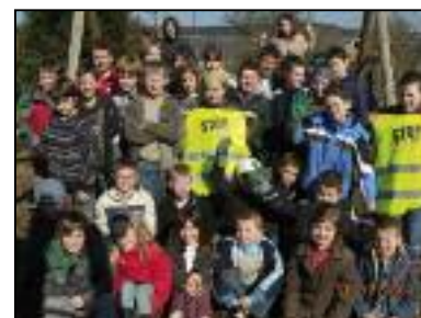
Les élèves de Vaux-Chavanne

Il n'y a pas d'âge pour être propre. L'opération de nettoyage de cette année a été l'occasion pour les enfants participants de s'engager pour leur environnement. En effet, chacun d'entre eux a signé un certificat au travers duquel il promet de ne rien jeter dans la nature. Ce petit geste est un geste fort car les jeunes qui s'investissent aujourd'hui sont les adultes de demain.