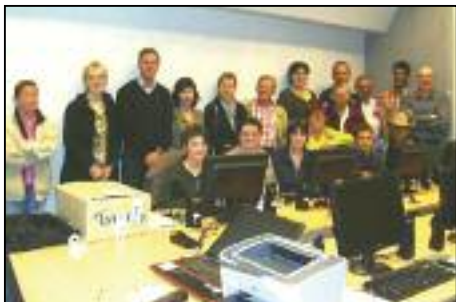
Le Conseil de l'Action sociale lors de sa visite à l'ECI