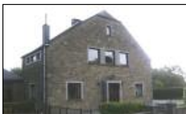
Grandménil — Rue A.Poncelet, 1 086/45.54.22 - 0478/60.46.79