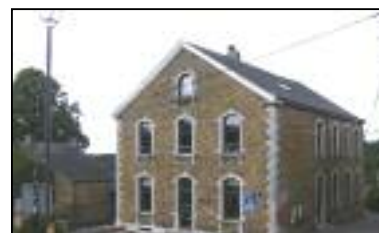
Harre — Rue du Châtaignier, 14 086/43.36.48 - 0478/60.46.79