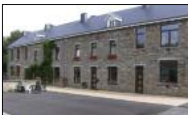
Dochamps — Rue du Vieux Frêne 24 084/44.40.75 — 0478/60.46.79