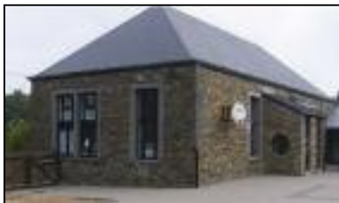
Malempré — Rue St Martin, 35 086/45.54.66 - 0478/60.46.79