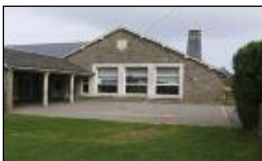
Vaux-Chavanne Rue Villers de Chavan, Vaux-Chavanne, 13 086/45.54.94 - 0478/60.46.79

Une garderie est organisée le matin et le soir dans nos différentes implantations.