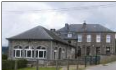
Odeigne — Rue du Souvenir, 1 0478/60.46.79