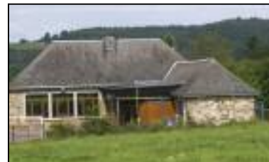
Oster — Chemin des Ecoliers, 7 086/45.57.76 - 0478/60.46.79