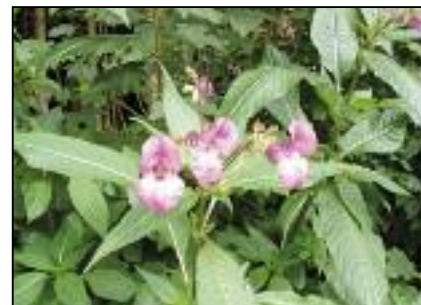
Balsamine de l'Himalaya

Ce règlement peut être obtenu sur simple demande auprès du secrétaire au 086/45.03.21