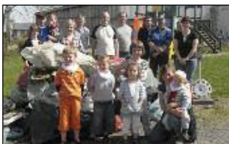
" Une partie des habitants de Malempré ayant participé au ramassage des déchets".

Gageons que les efforts fournis feront évoluer les comportements et contribueront à améliorer durablement la qualité de notre espace de vie.