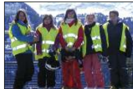
les 5 filles des écoles communales

A l'unanimité, nous sommes tous revenus avec de très beaux souvenirs plein la tête de cette nouvelle expérience. L'air de la montagne, ses beaux paysages et la neige a ramené des enfants pétillants avant de terminer en beauté cette toute dernière année pour beaucoup d'enfants dans les écoles primaires.