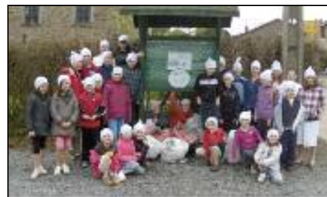
Les élèves de Vaux-Chavanne