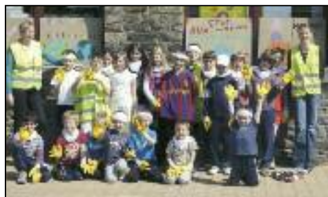
Les élèves de Dochamp