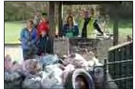
et de Deux-Rys...