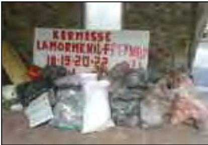
Les déchets collectés à Lamormenil