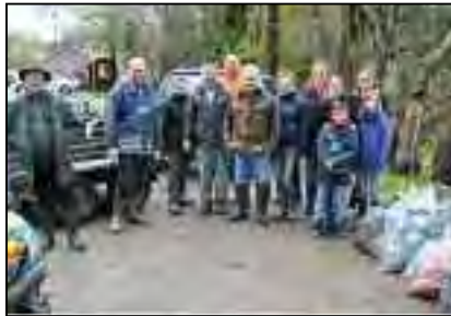
Des habitants de Dochamp