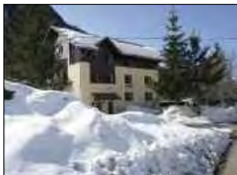
La Chaudane, chalet où nous dormions