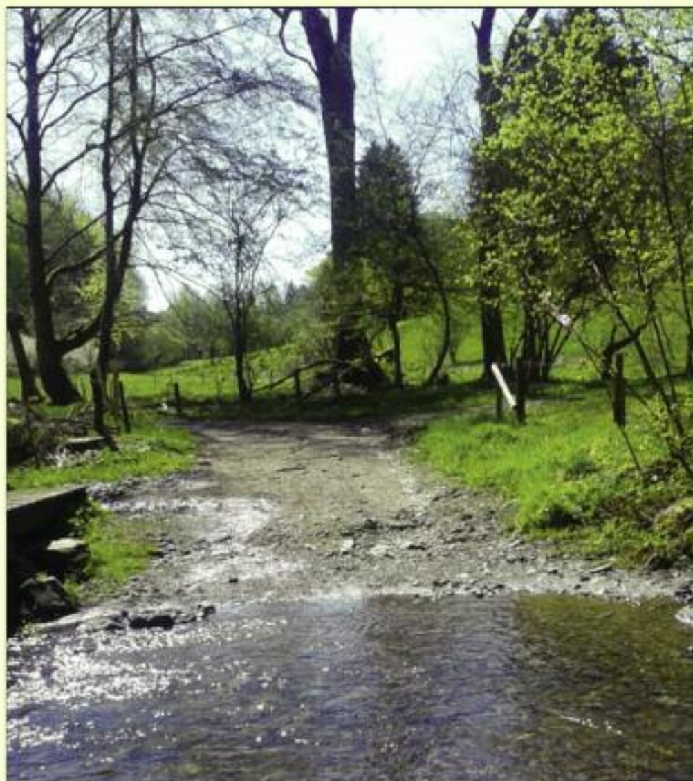
Pont d'Oster à Odeigne

Numéro-vert de l'administration communale : 0800/25959