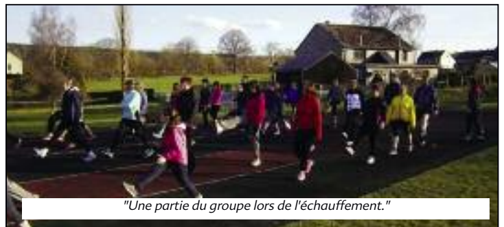
"Une partie du groupe lors de l'échauffement."

Le 4 avril a débuté la 8ème session de « Je cours pour ma forme » à la piste d'athlétisme de Manhay. Ce programme de mise en condition physique permet de découvrir le plaisir de courir en groupe. 75 personnes se sont inscrites à cette session de printemps 2016, un record de participation qui démontre l'intérêt grandissant porté par de nombreuses personnes pour cette activité proposée par la commune de Manhay.