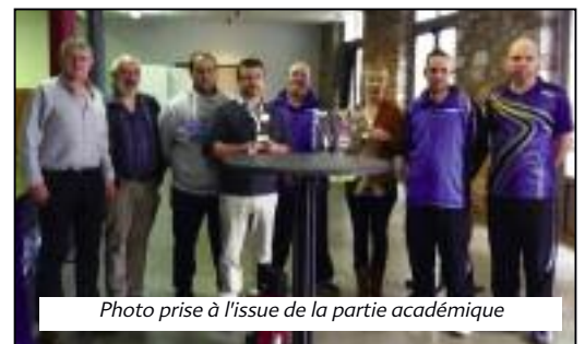
Photo prise à l'issue de la partie académique