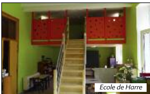
Ecole de Harre

Ce projet scientifique aboutira sur une exposition qui se tiendra à la salle de l'Entente le vendredi 5 mai 2017. Nos petits « Einstein » présenteront leurs découvertes, les démarches scientifiques effectuées et vous feront réaliser différentes expériences.