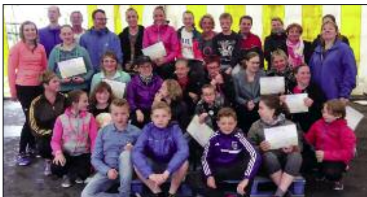
Photo prise lors de la remise des diplômes de la session de "Je cours pour ma forme" printemps 2016.