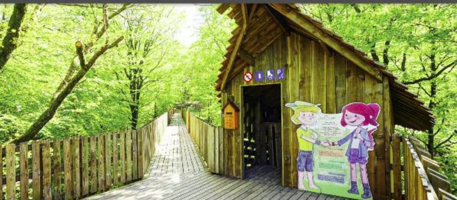
Parc Chlorophylle : La nouvelle attraction dans la cime des arbres

PÉRIODIQUE D'INFORMATIONS COMMUNALES - TRIMESTRIEL