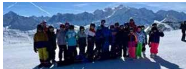
Les classes de neige pour les élèves de 5ème et 6ème primaire