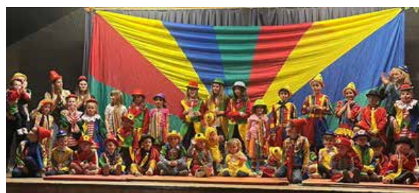
Spectacle scolaire et découverte du monde du cirque