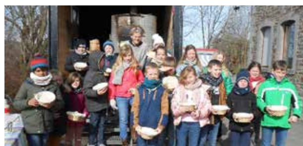
L'éveil à la culture, c'est aussi la découverte de l'artisanat et des artisans locaux ! Animation « Four à pain » en collaboration avec le moulin d'Odeigne suite à un appel à projet.