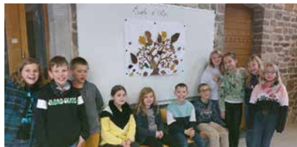
Animation à l'arboretum Robert Lenoir de Rendeux. L'une de nos implantations a reçu le prix Coup de cœur pour leur création artistique, ils recevront un arbre fruitier à l'automne.